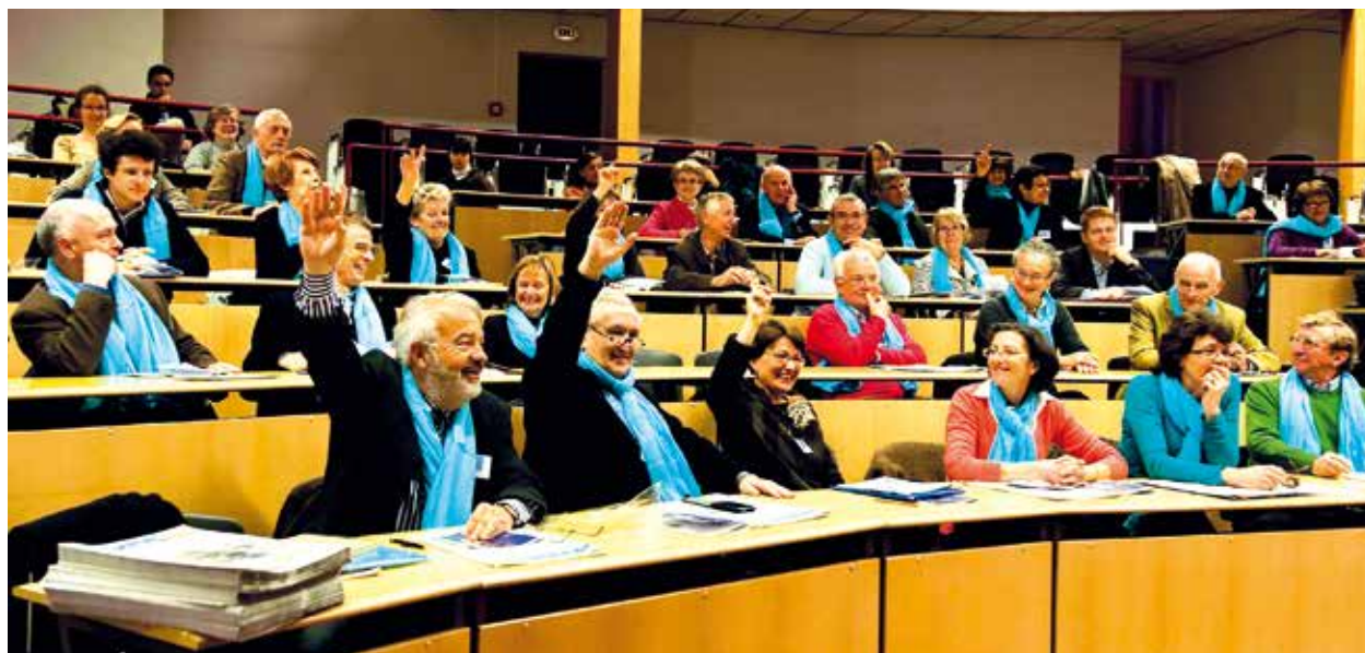
Pèlerinage des élus à Lourdes.