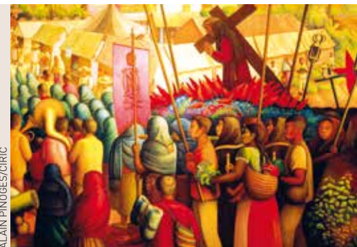
« Le Portement de croix », de Diego Rivera, Palais National, Mexique.

Cependant Jésus ne se révélera pas comme le Messie royal puissant qu'il imagine, mais comme celui qui passera par la souffrance et par la mort pour apporter le salut aux hommes.